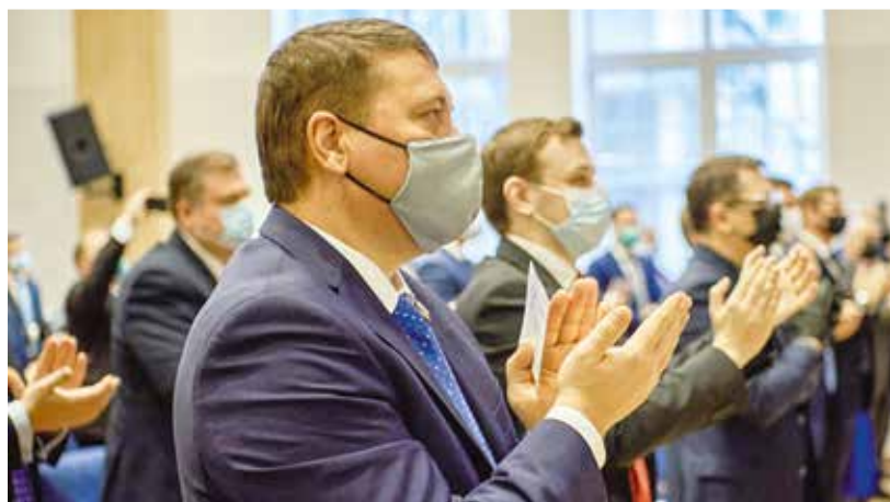
32-й СЪЕЗД ЛДПР