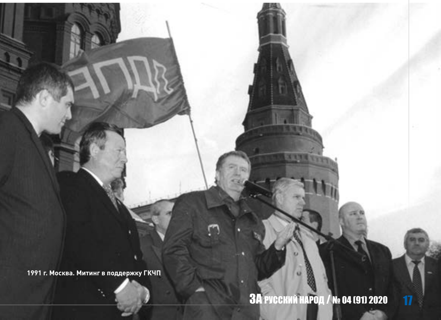
1991 г. Москва. Митинг в поддержку ГКЧП

Только решив социальные и экономические вопросы, можно вернуться к геополитическим.