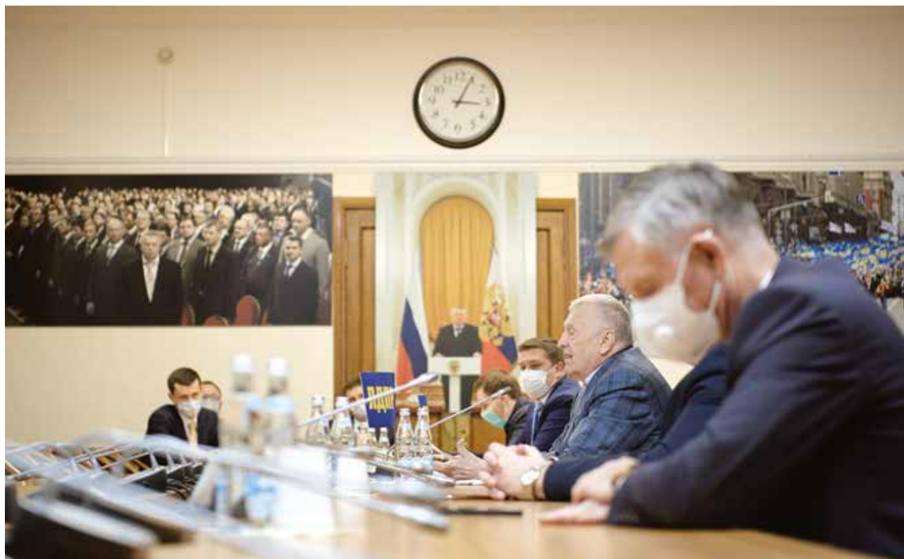
КРУГЛЫЙ СТОЛ «ДИСТАНЦИОННОЕ ОБРАЗОВАНИЕ: «ЗА» И «ПРОТИВ»