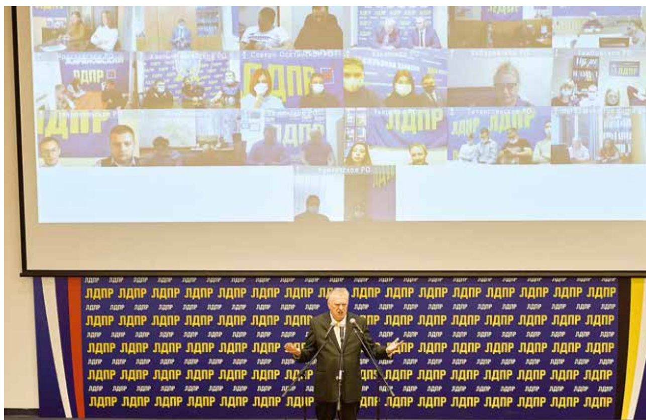
ОНЛАЙН-МИТИНГ ПО СЛУЧАЮ ДНЯ НАРОДНОГО ЕДИНСТВА