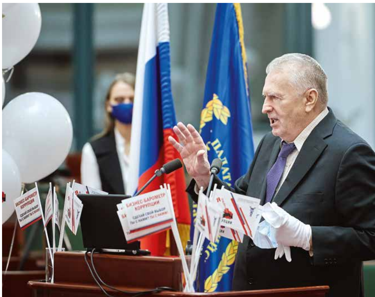
ВВЖ НА ЗАСЕДАНИИ ТОРГОВО-ПРОМЫШЛЕННОЙ ПАЛАТЫ РОССИИ