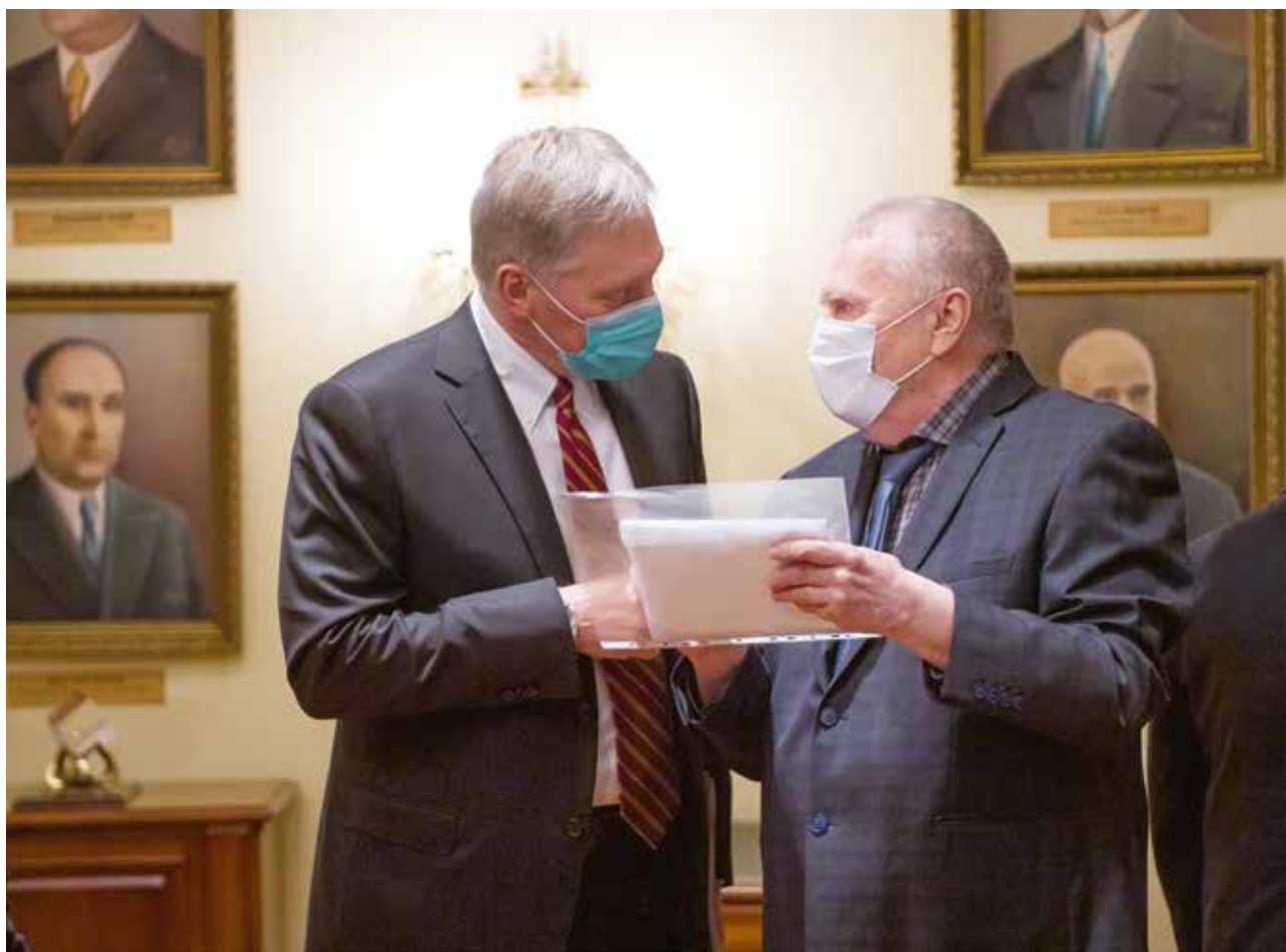
ВЛАДИМИР ЖИРИНОВСКИЙ НА ПОПЕЧИТЕЛЬСКОМ СОВЕТЕ ИСАА МГУ